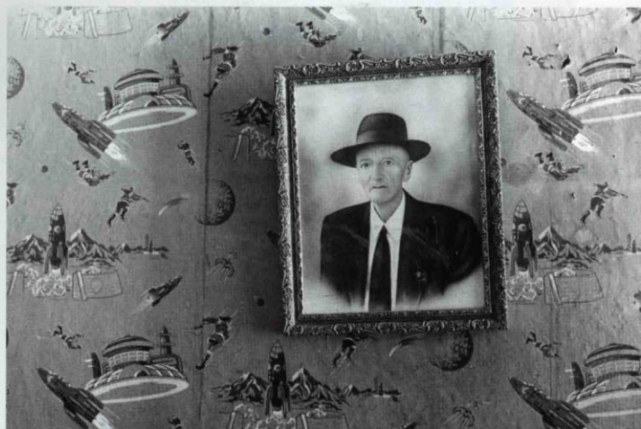
IZQUIERDA: 'COLOMBIA 1996', A LA DERECHA: 'COLOMBIA 1997' dos de las fotografías que harán parte de la exhibición en el Aeropuerto Internacional de Miami